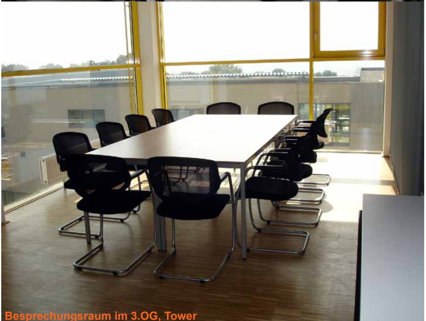
Besprechungsraum im 3.OG, Tower