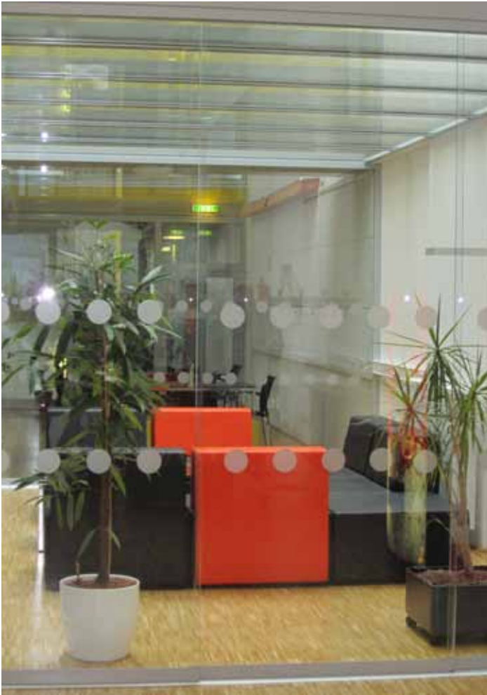
„Get-together Zone“ im Erdgeschoss