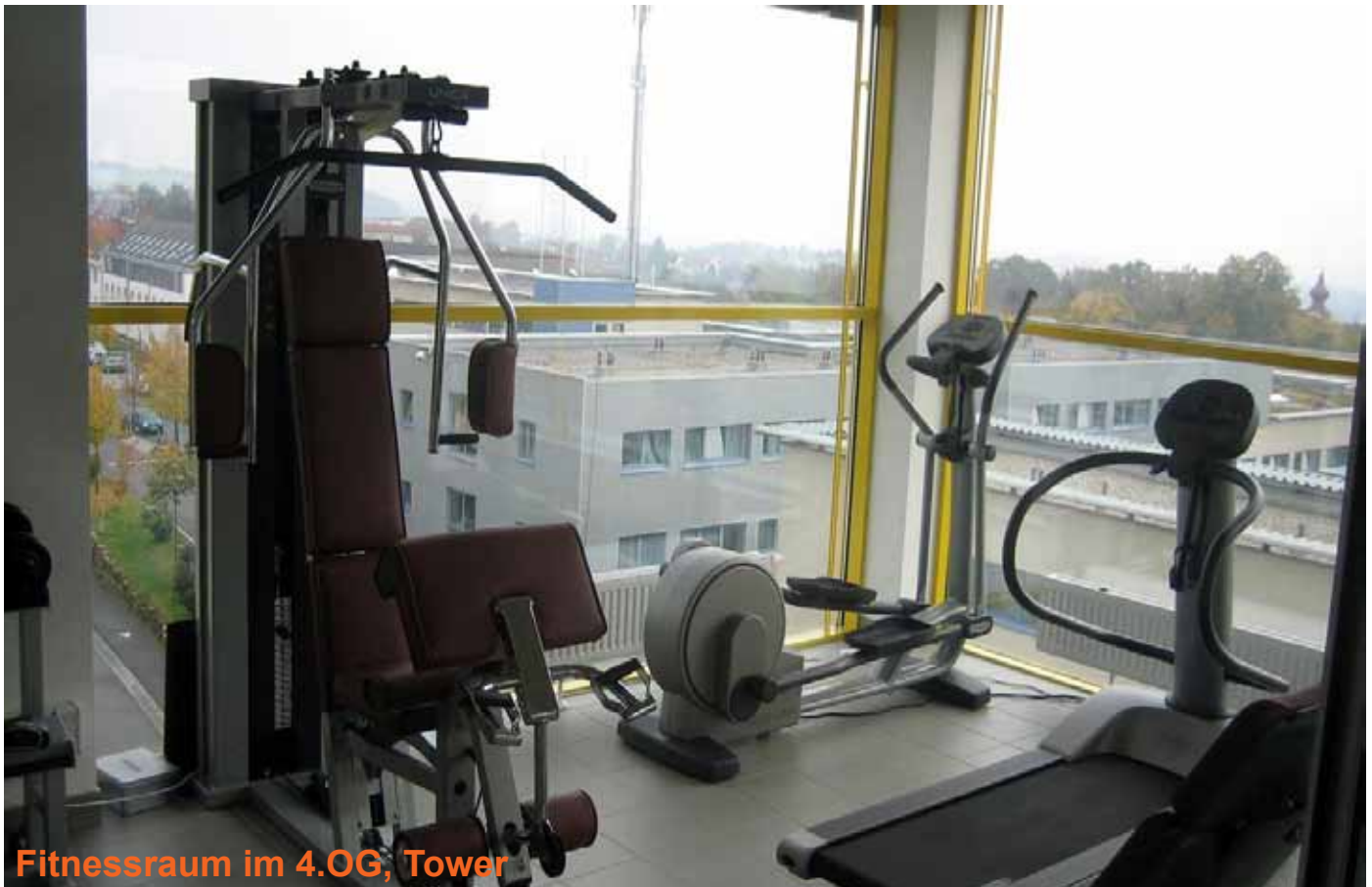
Fitnessraum im 4.OG, Tower